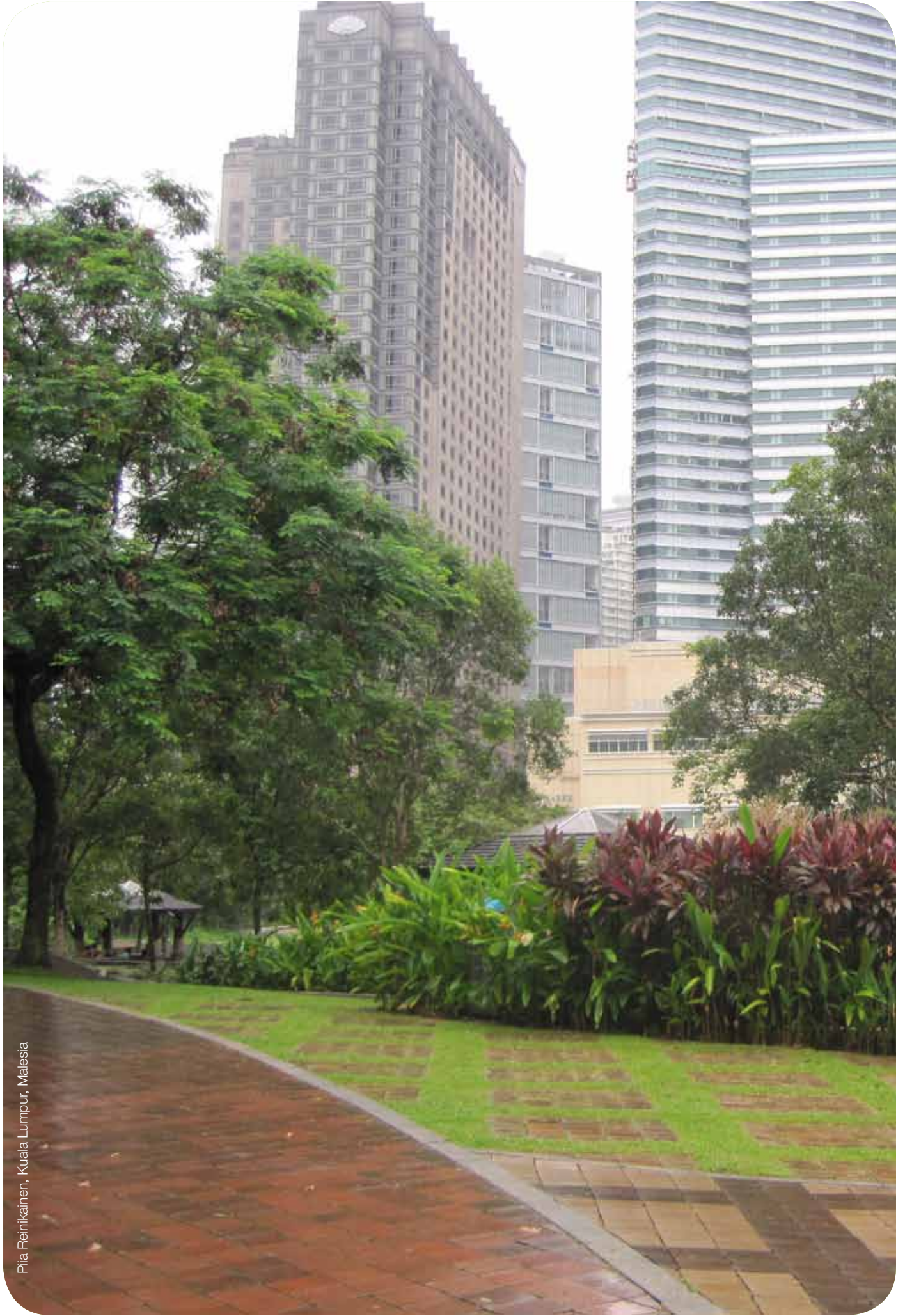
Pia Reinikainen, Kuala Lumpur, Malaysia